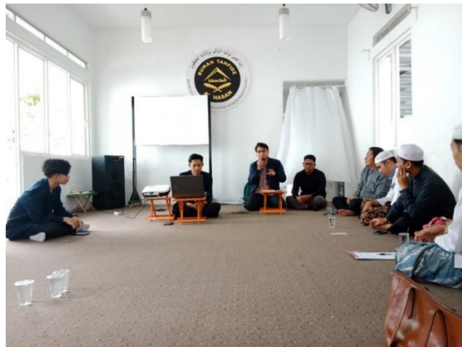
Gambar 3. Antusiasme Peserta PKM Tahfidz Dalam Mengikuti Kegiatan PKM