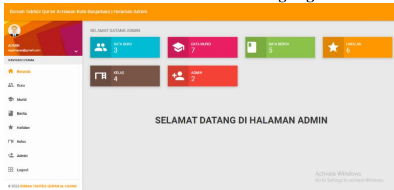
Gambar 5. Halaman Admin Pengelola