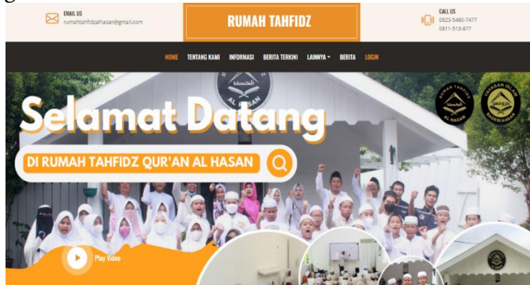
Gambar 4. Halaman Landing Page

Hasil rancang bangun web pada kegiatan pegabdian ini dapat dilihat pada Gambar 4 sampai dengan Gambar 7.