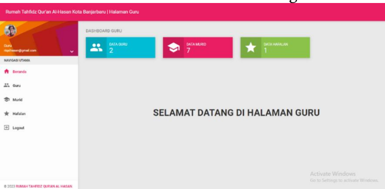
Gambar 6. Halaman Pengajar