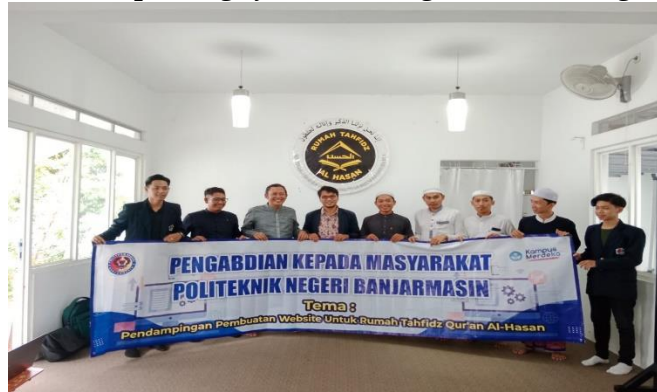
Gambar 2. Foto Bersama dengan Peserta PKM Rumah Tahfidz Qur'an Al-Hasan

Berbekal semangat dan keinginan yang kuat, peserta pengabdian secara antusias datang untuk mengikuti pendampingan pelatihan pembuatan website. Kegiatan pengabdian kepada masyarakat dilaksanakan pada jam 13.00 - 15.30 WITA pada hari minggu. Pada pendampingan pelatihan pembuatan website, peserta didik dibekali tentang pengetahuan awal pentingnya website bagi suatu lembaga/organisasi.