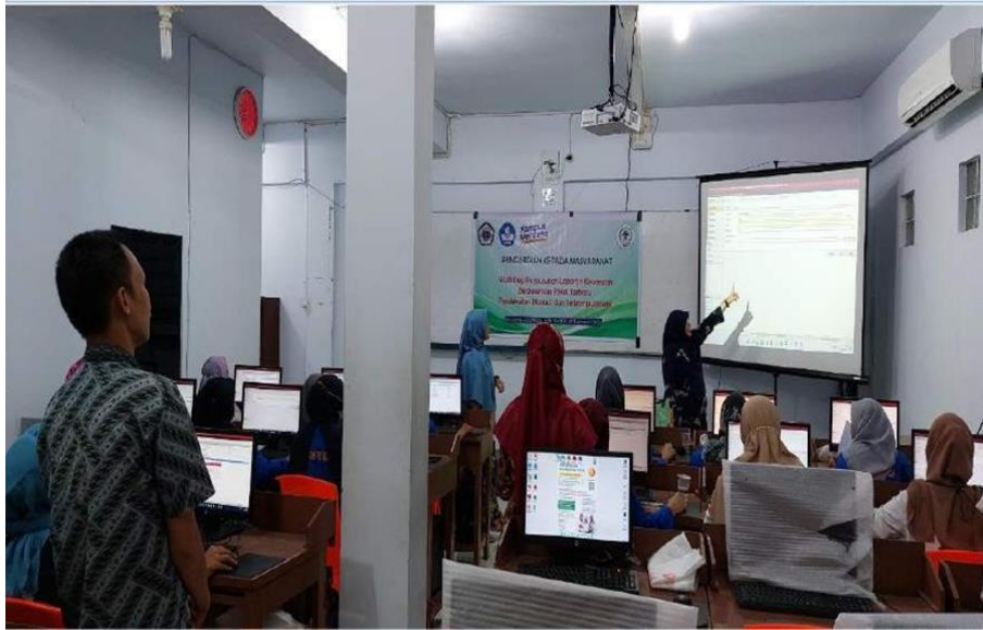
Gambar 4. Pelaksanaan Workshop Penyusunan Laporan Keuangan Mahasiswa Akademik Akuntansi YPK Medan

penyusunan laporan keuangan baik secara manual maupun dengan pengoperasian aplikasi Accurate , tahapan dalam mengelola bukti-bukti transaksi dan buku jurnal perusahaan dan tahapan menyelesaikan siklus akuntansi perusahaan.