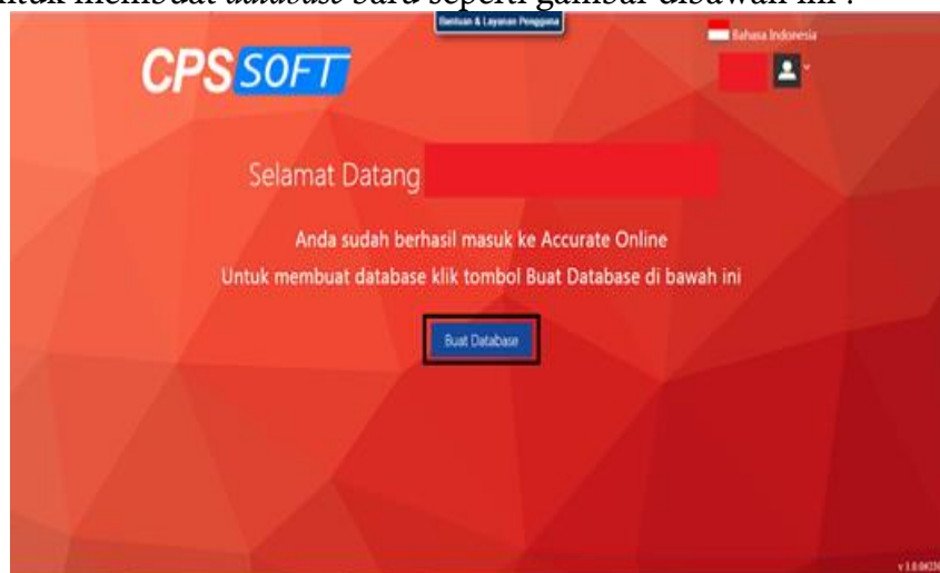
Gambar 1. Tampilan klik “Buat Database”

Adapun data yang di input kan tahun 2020, sehingga setelah mengklik tampilan maka akan muncul Laporan Keuangan neraca perusahaan JW Net untuk bulan Februari. Setelah berhasil mendaftar email dan login langkah selanjutnya adalah membuat database yang akan berisi semua data terkait pembukuan dan transaksi bisnis . Klik tulisan “Buat Database” untuk membuat database baru seperti gambar dibawah ini :