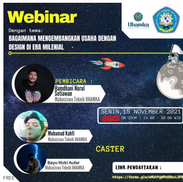
Gambar 1. Pelaksanaan Kegiatan