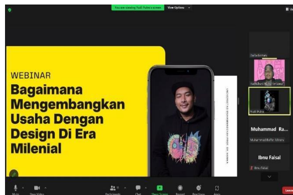
Gambar 2. Pembahasan Materi