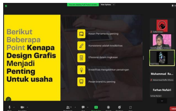
Gambar 4. Sesi Tanya Jawab