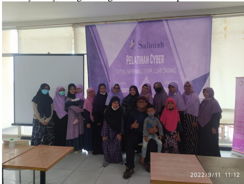
Gambar 5. Panitia dan Tim Abdimas

Acara ditutup dengan pemberian doorprize dan makan siang dari sponsor kegiatan yaitu Tobys dan Yayasan yatim gemilang. Berikut adalah panitia dan tim abdimas :