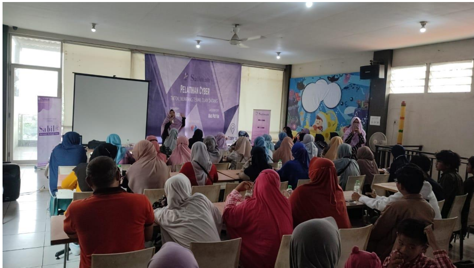
Gambar 3. Pembukaan Pelatihan oleh Tim Panitia Abdimas