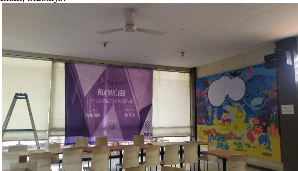
Gambar 1. Ruang Pelatihan

Kegiatan pelaksanaan dilakukan secara offline dan dimulai pukul 09.00 sampai siang hari. Peserta dari berbagai wilayah di kota Sidoarjo. Pelatihan dimulai dengan pendahuluan dari narasumber dan dilanjutkan dengan pengalaman narasumber dalam membuat konten TikTok untuk proses pemasaran digital. Narasumber memberikan contoh berdasarkan pengalamannya dalam membuat video berdurasi pendek dan ternyata lebih menarik. Gambar berikut adalah tempat pelaksanaan kegiatan pelatihan di lantai 2 Tobys Taman, Sidoarjo.