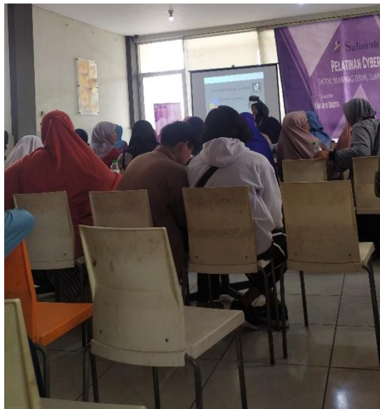
Gambar 4. Penyampaian Materi oleh Narasumber

Kegiatan pelatihan digital marketing ini berlangsung sampai siang hari. Kegiatan pelatihan berjalan dengan lancar, semua peserta mengikuti dengan seksama penjelasan dari narasumber. Keterbatasan dalam pelatihan ini adalah ruang pelatihan yang tidak kondusif. Lokasi terletak di lantai 2 Tobys dan hanya terdapat kipas angin sehingga ruangan cukup panas bagi peserta yang berjumlah 44 peserta. Pelatihan ini diselingi dengan beberapa icebreaking dari Yayasan Yatim Gemilang. Doorprice dan hadiah dibagikan kepada peserta yang aktif bertanya dan menjawab pertanyaan narasumber dengan benar.