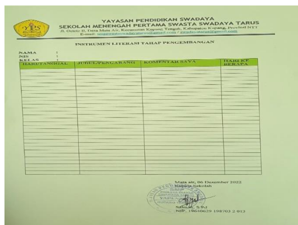
Gambar 4. Jurnal Membaca Tahap Pengembangan

Gambar 3 & 4 menunjukkan dua model instrument literasi yang dihasilkan dari proses pendampingan yaitu jurnal membaca harian untuk tahapan pembiasaan dan juga jurnal membaca harian tahapan pengembangan. Yang membedakan kedua instrumen diatas yaitu pada tahap pembiasaan, setelah siswa melakukan kegiatan membaca, siswa mengisi jurnal membaca hariannya berupa judul buku serta jumlah halaman yang dibaca, sedangkan pada instrumen literasi tahap pengembangan, terdapat kolom tanggapan dimana siswa diwajibkan untuk memberikan komentar atau tanggapan terkait hasil bacaan.