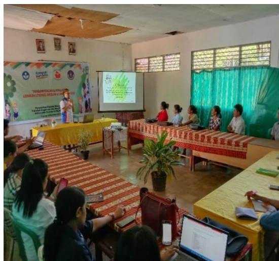
Gambar 1. Sosialisasi Gerakan Literasi Tingkat SMP

Pelaksanaan pendampingan dan penguatan gerakan literasi sekolah di SMPS Swadaya diawali dengan sosialisasi oleh tim PKM kepada guru-guru dengan materi yang diberikan yaitu “Gerakan literasi sekolah tingkat SMP”. Berdasarkan pelaksanaan sosialisasi terkait gerakan literasi sekolah, menunjukkan semua warga sekolah telah memiliki pemahaman terkait gerakan literasi sekolah mulai dari tahap pembiasaan, tahap pengembangan, dan tahap pembelajaran. Setelah guru mengikuti kegiatan sosialisasi disampaikan bahwa selama ini pelaksanaan literasi di sekolah SMPS Swadaya hanya terbatas pada tahap pembiasaan.