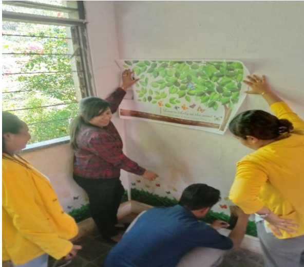
Gambar 5. Proses Desain Pojok Baca

Selanjutnya tim PKM juga berhasil mendampingi sekolah dalam membentuk tim literasi sekolah, dimana sekolah telah menerbitkan surat keputusan tim literasi sekolah SMPS Swadaya dengan nomor SK. 117/422.124.2/SMP.SWDT/SK/XII/2022. Dengan terbentuknya tim literasi sekolah diharapkan agar sekolah SMPS Swadaya menjadi rolemodel sekolah tingkat SMP di Kabupaten Kupang yang menerapkan program literasi smulai dari tahap pembiasaan, tahap pengembangan sampai pada tahap pembelajaran. Kegiatan selanjutnya yang dilakukan oleh tim PKM yaitu mendampingi guru dalam mendesain pojok baca di salahsatu ruang belajar yaitu pada kelas VIII.