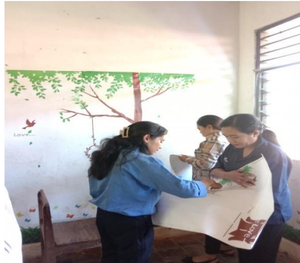
Gambar 6. Proses Desain Pojok Baca