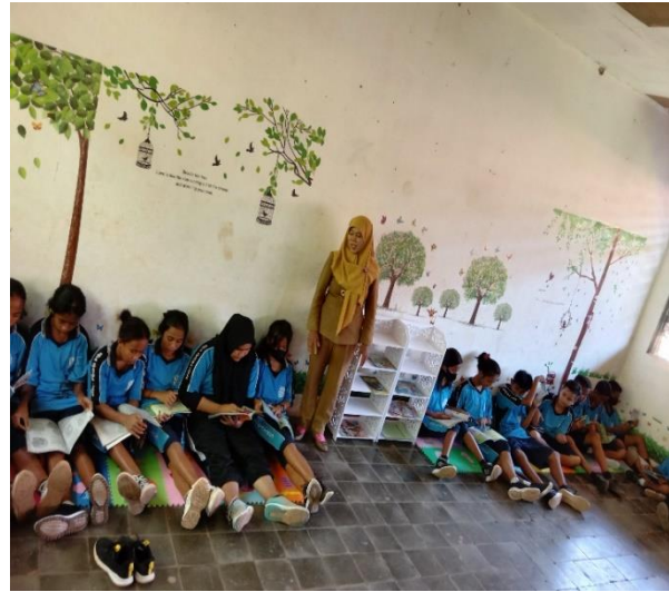
Gambar 9. Para Siswa sedang Membaca Gambar 10. Para Siswa sedang Membaca

Pada gambar 9 & 10 menunjukkan siswa kelas VIII sedang melakukan kegiatan membaca 15 menit sebelum pembelajaran dimulai. Tampak antusiasme siswa dalam memanfaatkan pojok baca untuk melakukan kegiatan membaca buku sesuai dengan kesukaan dan minat siswa terhadap jenis bacaan yang gemari. Setelah siswa melakukan kegiatan membaca siswa diarahkan untuk mengisi jurnal membaca harian dalam instrument yang telah dibuat oleh tim PKM dan guru SMPS Swadaya. Wandasari, (2017) dalam penelitiannya menjelaskan pembiasaan membaca buku non pelajaran seperti 15 menit diawal pelajaran, disesuaikan dengan minat peserta didik dan dilakukan dalam suasana menyenangkan, serta pada tahap pembiasaan membaca ini tidak diikuti dengan tugas tambahan. Berdasarkan hasil PKM di SMPS Swadaya dalam pelaksanaan gerakan lietrasi akan dimulai dari tahap pembiasaan dengan memanfaatkan sumber bacaan non pelajaran dan akan di evaluasi menggunakan instrument jurnal membaca harian yang telah dibuat.