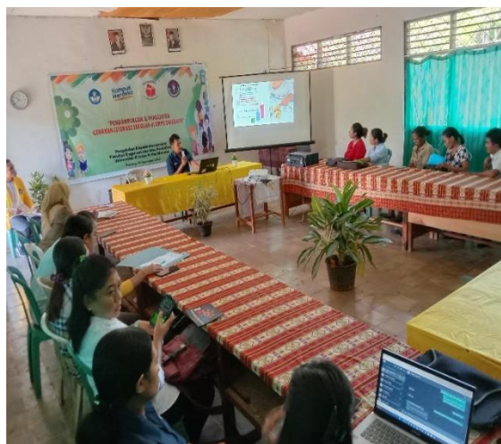
Gambar 2. Pendampingan Pembuatan Instrument Literasi