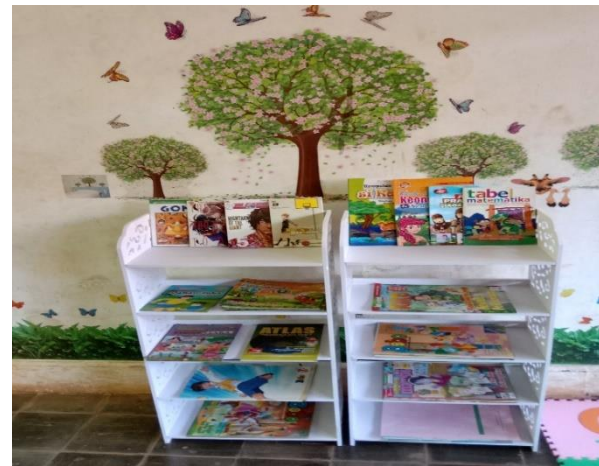
Gambar 8. Proses Desain Pojok Baca

Tim PKM bersama guru dan siswa SMPS Swadaya mendesain pojok baca dengan memasang wallpaper pohon dan wallstiker, serta juga dilakukan pemasangan matras puzzle sebagai tempat bagi siswa duduk dalam melakukan kegiatan membaca, tim PKM juga memenuhi pojok baca dengan buku – buku literasi yang dipajang dirak buku yang disediakan. Adapun jenis buku yang diberikan yaitu buku fiksi dan non fiksi seperti buku cerita, komik, majalah boboo, serta poster-poster literasi. Batubara & Ariani (2018) menjelaskan ketersediaan Pojok baca dalam kelas berguna untuk mendekatkan buku kepada peserta didik dan sebagai fasilitas kegiatan kegiatan membaca 15 menit sebelum