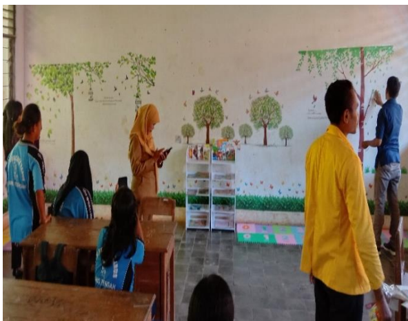
Gambar 7. Proses Desain Pojok Baca