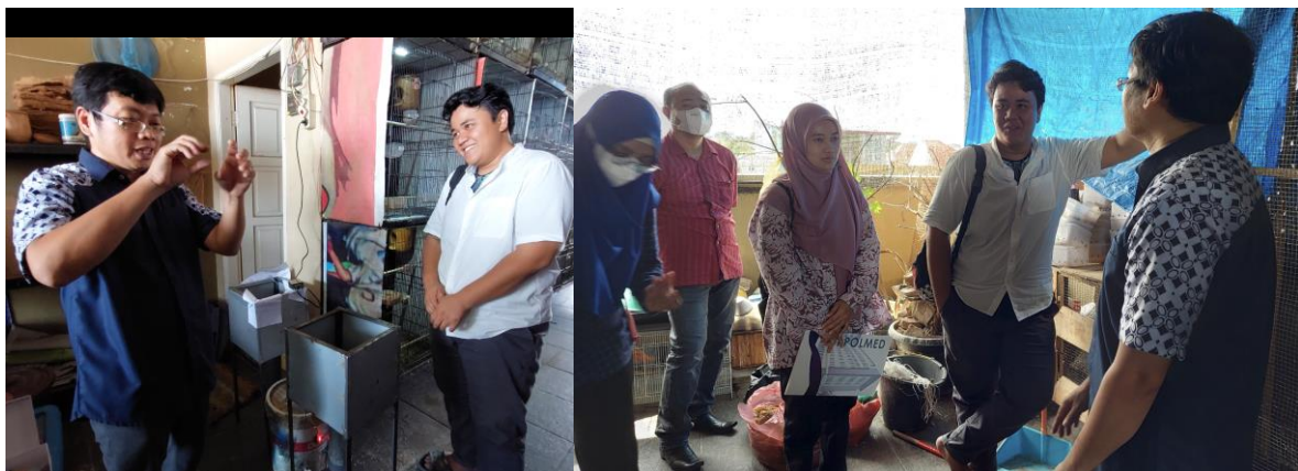
Gambar 4. Diskusi Tim PKM POLMED dengan Pemilik dan Pegawai UMKM Kampung Ternak

Pada tahun pertama, aplikasi akan dihubungkan dengan website sehingga pemilik dan tim PKM dapat melakukan pemantauan secara langsung. Website juga akan digunakan sebagai media bagi tim PKM untuk melakukan evaluasi secara tidak langsung kepada target mitra dan sistem IOT yang dijalankan. Website yang digunakan dalam aplikasi ini hanya akan dibiayai selama setahun sebab pembayaran biaya tahunan website selanjutnya ditanggung oleh mitra, sehingga tidak akan dilaporkan proses selanjutnya. Setelah 1 tahun berjalan, aplikasi tetap akan dapat digunakan walaupun tidak menggunakan website .