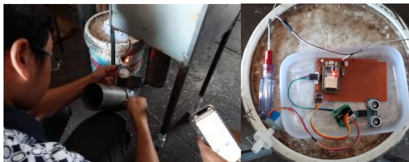
Gambar 2. Instalasi Alat Pemberi Pakan Otomatis

Sistem IOT yang telah dibangun memanfaatkan perangkat ESP32 dan koneksi internet. Untuk konfigurasinya, pemilik dapat melakukan konfigurasi dengan menekan tombol dan masuk ke dalam sistem perangkat.