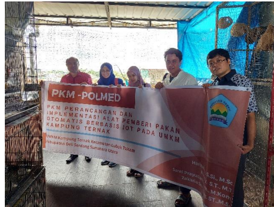
Gambar 5. Interaksi Langsung antara Tim PKM dan Pemilik dalam menguji coba alat

Kegiatan sosialisasi penggunaan sistem terlaksana dengan cukup baik dan lancar. Sistem dapat bekerja dan diterapkan pada beberapa tempat. Antusias pegawai dan pemilik dalam menggunakan dan mendapatkan bantuan peralatan yang merupakan implementasi teknologi IOT ini sangat besar. Pemilik UMKM Kampung ternak berharap dapat dikembangkannya perangkat yang lebih mudah dirakit dan dalam bentuk modul serta adanya bantuan dalam penanganan kendala bila memungkinkan.