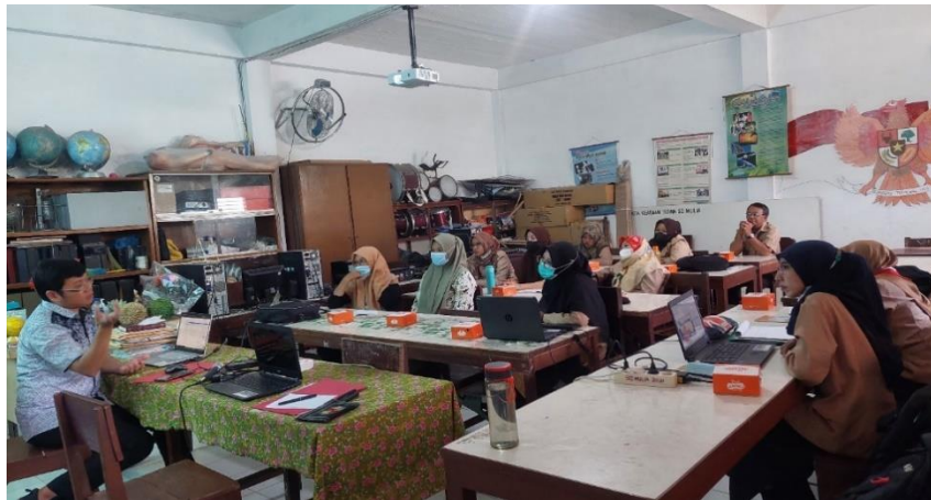
Gambar 2. Diskusi antara Tim PKM POLMED dengan Guru-Guru SD Yayasan Mulia

Kegiatan diskusi berjalan dengan lancar terbukti dengan banyaknya pertanyaan yang datang dari berapa guru dan saran serta harapan terhadap perkembangan dan kemajuan aplikasi pembelajaran berbasis multimedia. Tim dosen POLMED langsung memberikan arahan cara log in sebagai user pada web pembelajaran online berbasis multimedia dan juga menjelaskan beberapa fitur yang tersedia pada web pembelajaran.