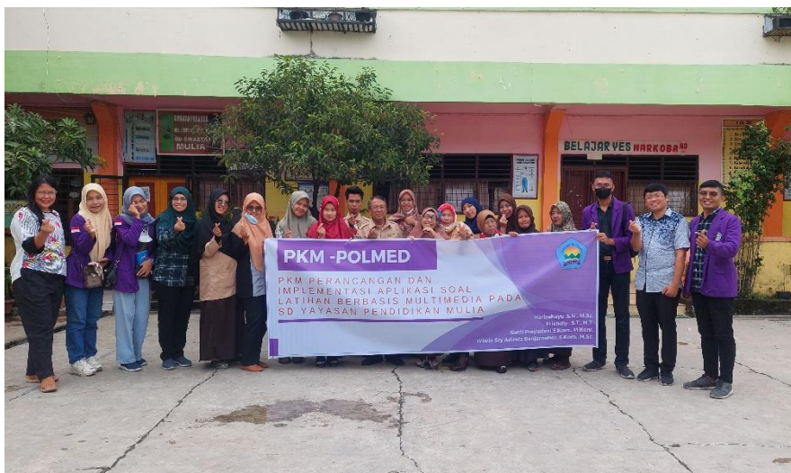
Gambar 3. Interaksi Langsung antara Tim dan Guru- Guru Yayasan SD Mulia pada Kegiatan Implementasi Soal Latihan Berbasis Multimedia

Kegiatan diskusi berjalan dengan lancar terbukti dengan banyaknya pertanyaan yang datang dari berapa guru dan saran serta harapan terhadap perkembangan dan kemajuan aplikasi pembelajaran berbasis multimedia. Tim dosen POLMED langsung memberikan arahan cara log in sebagai user pada web pembelajaran online berbasis multimedia dan juga menjelaskan beberapa fitur yang tersedia pada web pembelajaran.