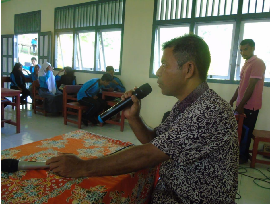
Gambar I : Bapak Kepala Sekolah SMA N 12 Halmahera Selatan memberikan pengarahan sebelum kegiatan pengabdian.