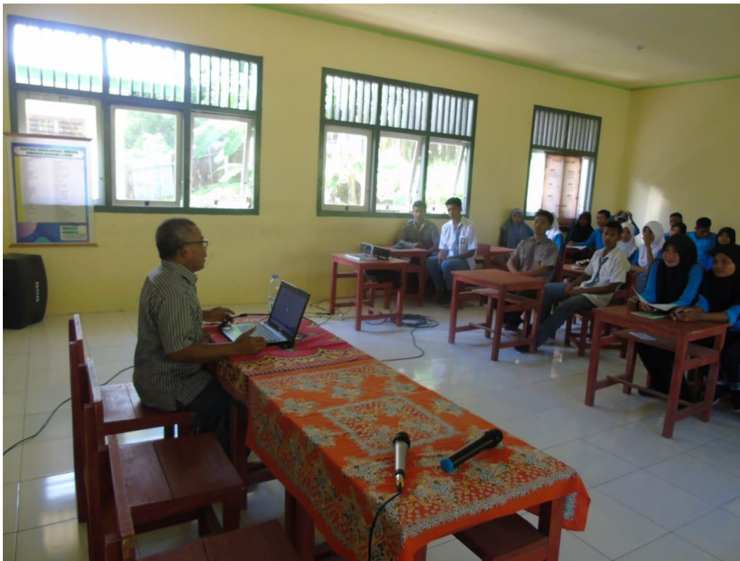
Gambar III : Proses kegiatan pengabdian di SMA N 12 Halmahera Selatan.