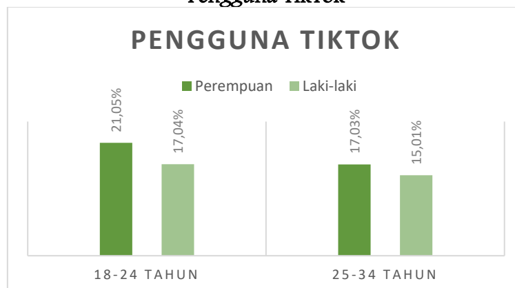
Diagram 1.2 Pengguna TikTok

Bisnis TikTok menarik orang karena kekuatan penyebarannya yang luar biasa. Menurut penelitian Yu Han (2020) di China pemasar dan vlogger dapat meraup keuntungan melalui iklan di TikTok kurang lebih 30%, dari semua pengguna internet, kini menggunakan pemblokir iklan. Namun orang tidak membenci iklan dalam aplikasi TikTok, mereka justru berkeinginan untuk melakukan pembelian. Iklan aplikasi TikTok cenderung menggunakan banyak orang untuk me-review suatu merek dagang dengan gaya bicara yang lebih membaur dan mudah di pahami oleh